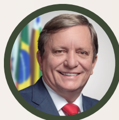
DARCI LERMEN Prefeito de Parauapebas