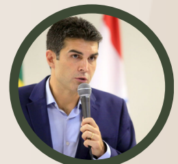
HELDER BARBALHO Governador do Pará